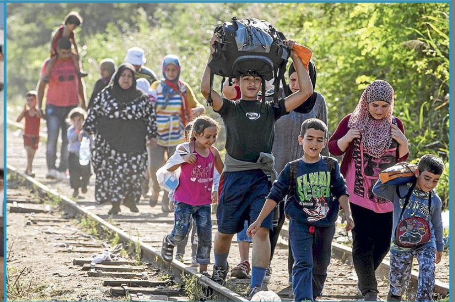
RUTA DE LOS BALKANES COLAPSADA POR REFUGIADOS